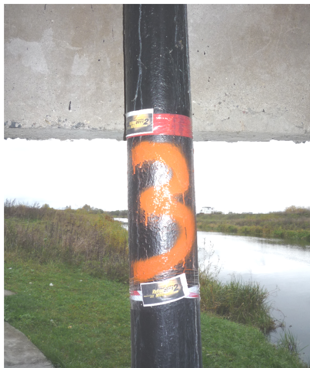
рис. 4: Символ КП нанесенный краской на техногенный объект (ЛЭП)