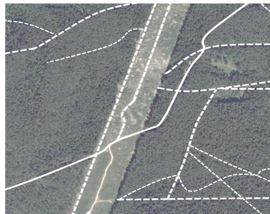
рис. 2: Отредактированный космоснимок