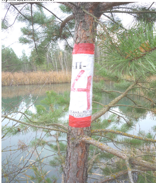
рис. 3: Символ КП изображенный на листе бумаги и приклеенный на природный объект (дерево).

На местности КП представляет собой символ, изображенный на объекте природного или техногенного характера. Символ КП изображается одним из следующих образом: (1) краской, которая наносится на объект, (2) листом бумаги, вложенным в непромокаемый файл, который наклеивается на объект. На каждом КП присутствует символика соревнований в виде эмблемы. Размер символа КП – не менее 30*20 см. Примеры КП приведены ниже: