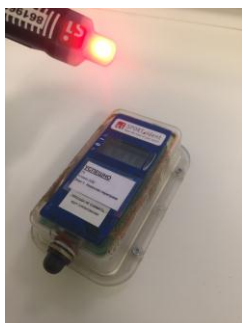
Рис.3 Отметка в бесконтактной станции