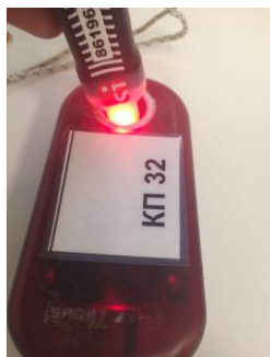
Рис.4 Отметка в контактной станции