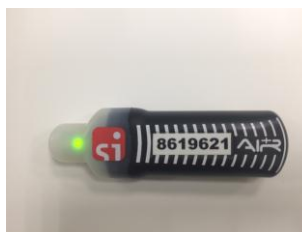
Рис.2 Периодически мигающий зеленый световой индикатор, говорит о том, что ЧИП находится в активированном состоянии и готов к работе.