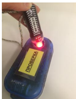
Рис.1 Световой индикатор, при успешной отметке (активации) в станции «ПРОВЕРКА»