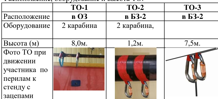
Схема дистанции. Расположение ТО, ВСВ и БЗ.

4. Расположение, оборудование и высота ТО: